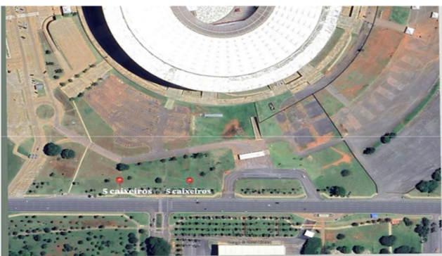
Área 03, 20 vagas de caixeiro no calçadão do Estádio Mané Garrincha, SRPN - Asa Norte/DF. TAKANE KIYOTSUKA DO NASCIMENTO