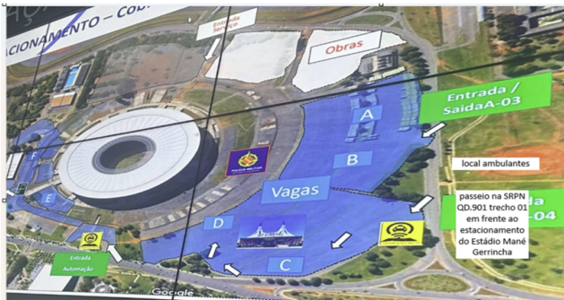
Área 01 |Local de Licenciamento – SRPN Qd.901 trecho 01 – Asa Norte/DF. (20 vagas).

7.4. O sorteio poderá contar com os Ambulantes que estiverem presentes ao final do horário limite de inscrição;