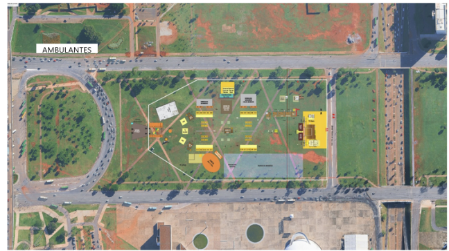
ÁREA DE LICENCIAMENTO – EM FRENTE A VIA N1, PRÓXIMO A PRAÇA DA CIDADANIA, NA ESPLANADA DOS MINISTÉRIOS.

13.1. Não haverá reserva de vagas no chamamento público para as associações representativas da categoria dos Ambulantes.