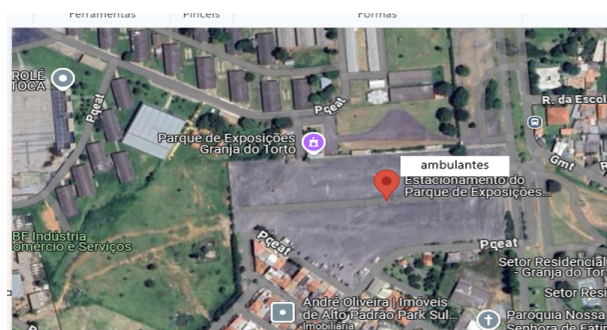
Área licenciamento no evento EXPOABRA BRASÍLIA – no canto direito do estacionamento da Granja do Torto.

13.1. Não haverá reserva de vagas no chamamento público para as associações representativas da categoria dos Ambulantes.