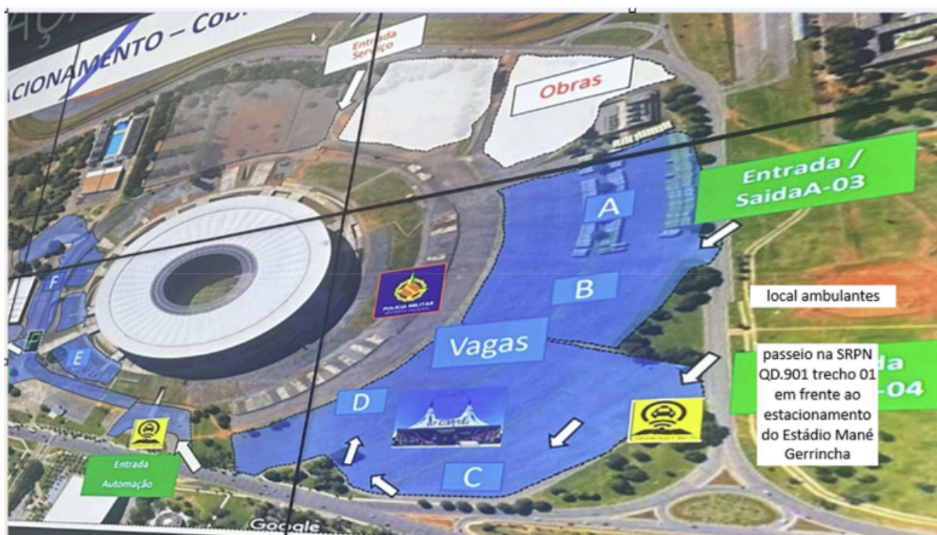
ÁREA 01 – 25 vagas na SRPN QD.901 trecho 01

13.1. Não haverá reserva de vagas no chamamento público para as associações representativas da categoria dos Ambulantes.