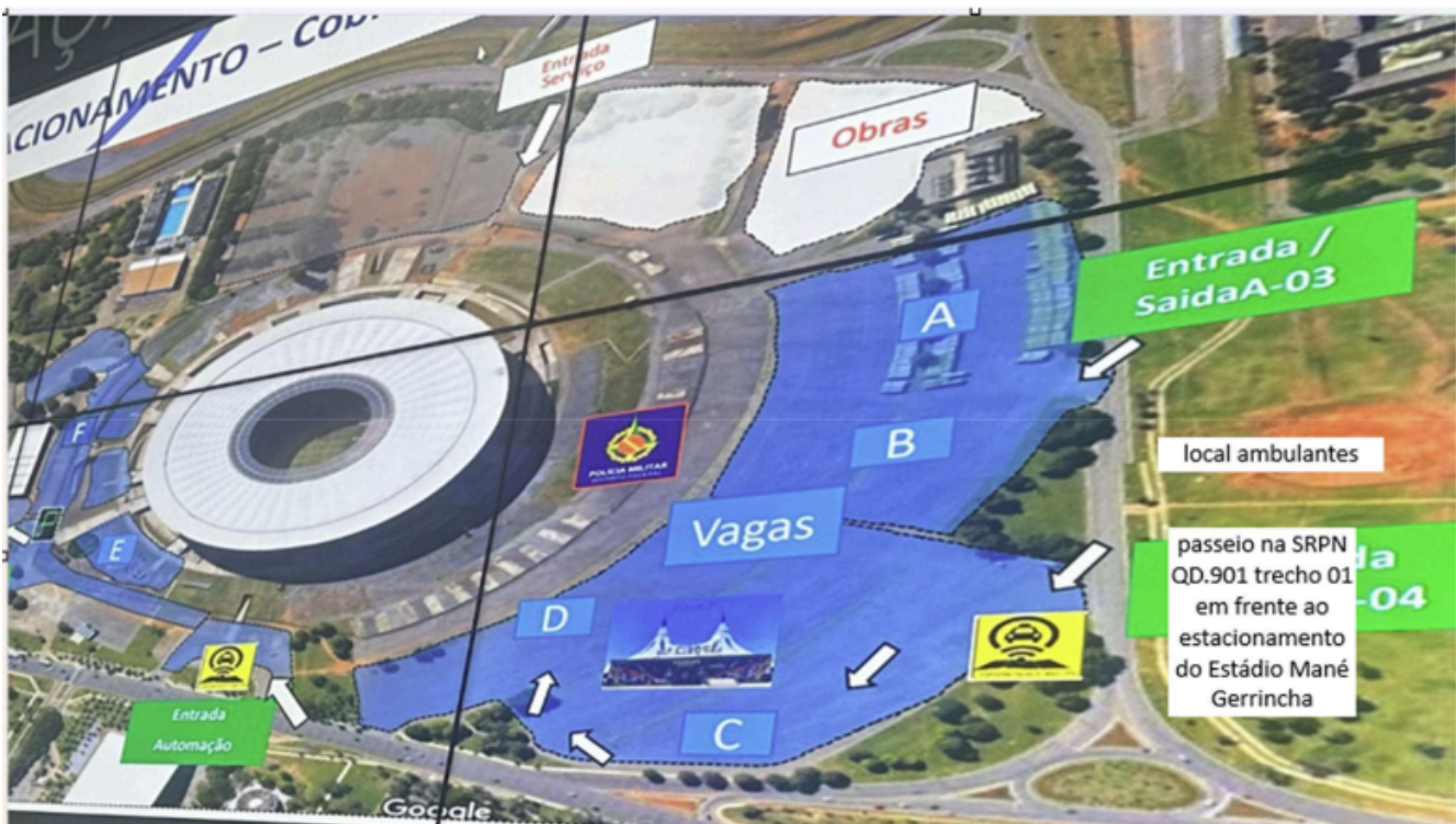
ÁREA 01 – 25 vagas na SRPN QD.901 trecho 01

13.1. Não haverá reserva de vagas no chamamento público para as associações representativas da categoria dos Ambulantes.