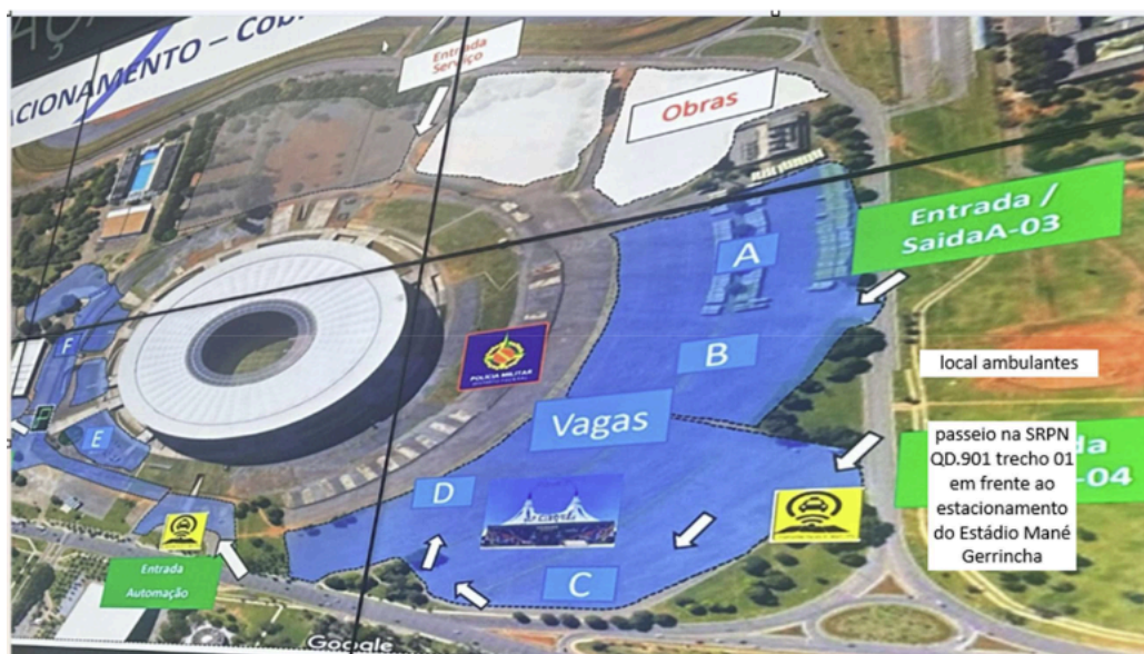
ÁREA 01 – 25 vagas na SRPN QD.901 trecho 01